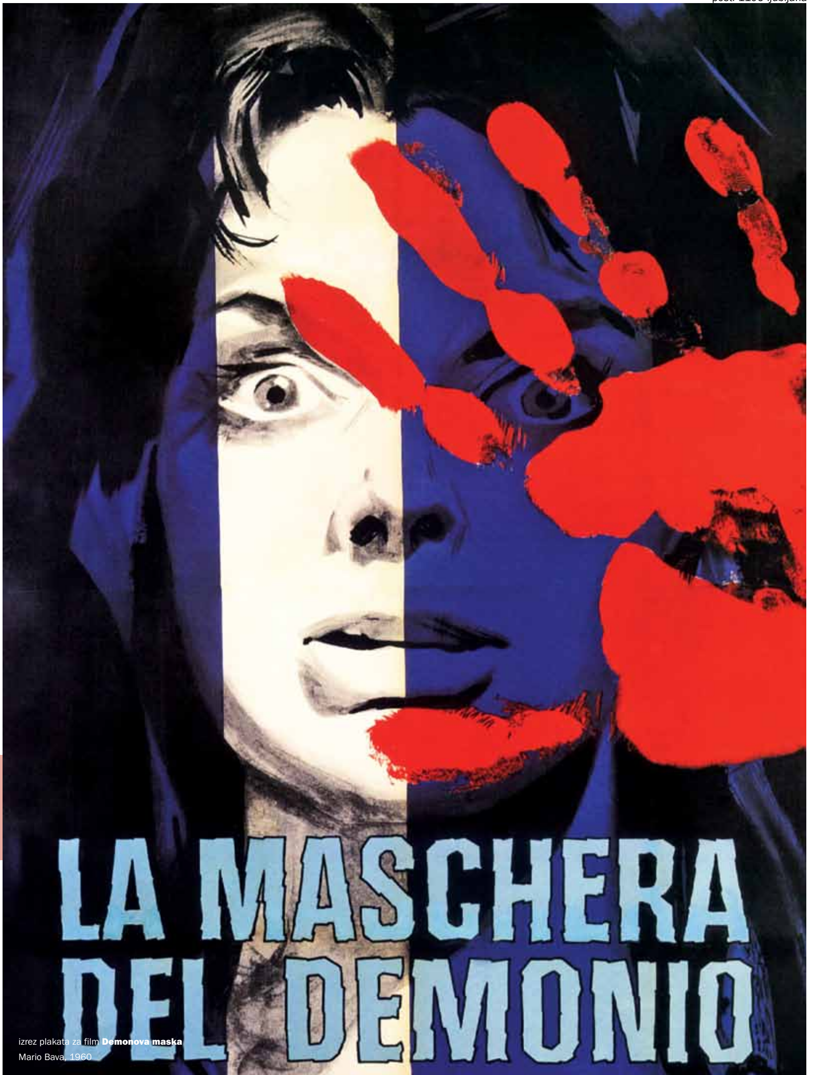
izrez plakata za film Demonova maska Mario Bava, 1960

mesečnik Slovenske kinoteke, letnik XV, številka 7-8, marec-april 2015